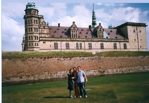
Гимназијалци испред Хамлетовог дворца