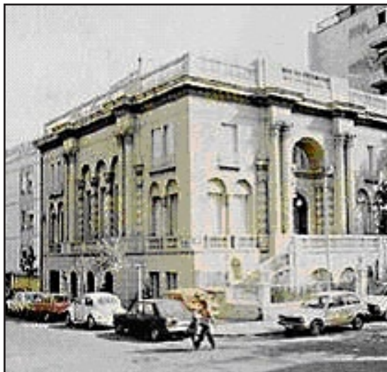
Музеј Николе Тесле у Београду

Федерални истражни биро САД-а у стопу је пратио Теслу до његове смрти, али и много касније сваки папир из његове заоставштине морао је да заврши у архиви FBI. Такође, праћени су и људи са којима је контактирао (пријатељи, поштар, секретарица...) Истраживачи чувене „Зоне 51”, у којој Пентагон обавља истраживања од највеће тајности без двоумљења тврде да су тамо Теслини радови централна област интересовања. Вјерује се да је најзначајнији дио Теслине документације остао у рукама америчке владе.