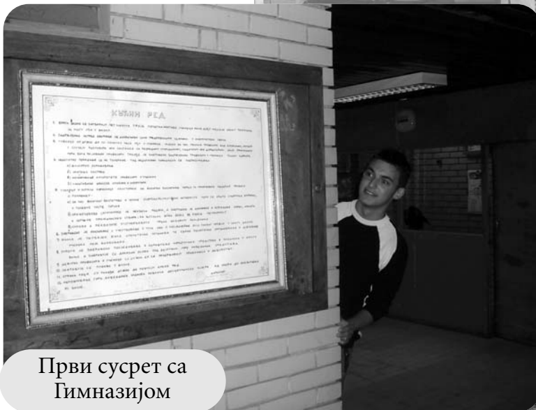
Први сусрет са Гимназијом

Прва екскурзија – Нови Сад. Већина је била, али идемо поново, обновити градиво. Одеш на екскурзију, како би обишао Нови Сад и када се вратиш, схватиш да си најбоље вријеме проводио у соби и аутобусу! Добро, вриједило је прошетати ако ништа, а онда због „Mc Donaldsa“! Дајте гладном чизбургер и жедном милк-шејк, не смета ни